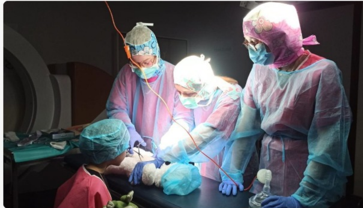
Au total, le centre SimUSanté accueille 16 classes d'enfants de grande section de maternelle jusqu'au CP.

Depuis ce lundi 5 février et jusqu'à jeudi 8 février, ce sont les doudous qui sont les patients du centre pédagogique SimUSanté à Amiens. Les étudiants de 19 filières différentes de santé ont convié les enfants de 16 classes à venir soigner leurs doudous. Une manière d'ouvrir les portes des établissements de santé, parfois pour la première fois pour ces jeunes de 3 à 7 ans. C'est une action entreprise par les étudiants amiénois, en partenariat avec le centre de simulation SimUSanté. Près de 300 étudiants sont mobilisés sur toute la semaine.