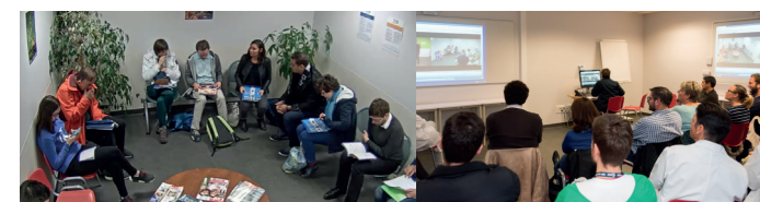
Salle d'attente simulée